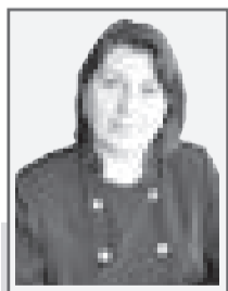
Софья АХМЕРОВА, судья Специализированного межрайонного административного суда Западно-Казахстанской области

С целью реформации государственного управления и судебной системы в Казахстане внедрена административная юстиция, предназначенная которой является нивелировать положения органов власти, граждан и юридических лиц, не уполномоченных на принятие административных актов и совершение административных действий.