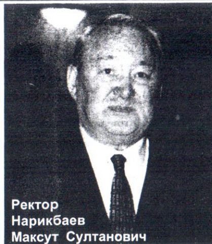
Ректор Нарикбаев Максут Султанович

Казахская Государственная Юридическая Академия - единственное в Казахстане специализированное государственное юридическое высшее учебное заведение, целью которого является реализация правовой реформы и удовлетворение потребности республики в юридических кадрах, развитие юридического образования и повышение его качества.